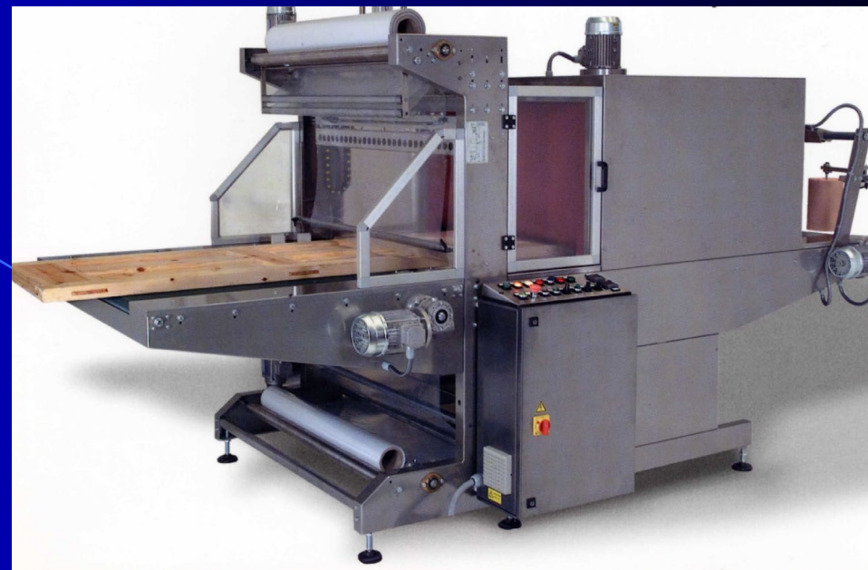
Fardeuse avec alimentation en ligne